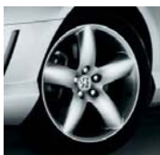
Jantes Alopias 18"