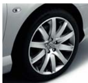
Jantes Nineteen 19"