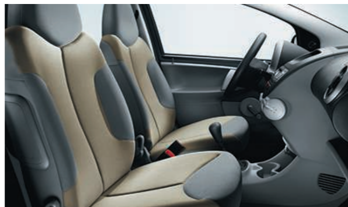
Maille Nokimate Beige Sable