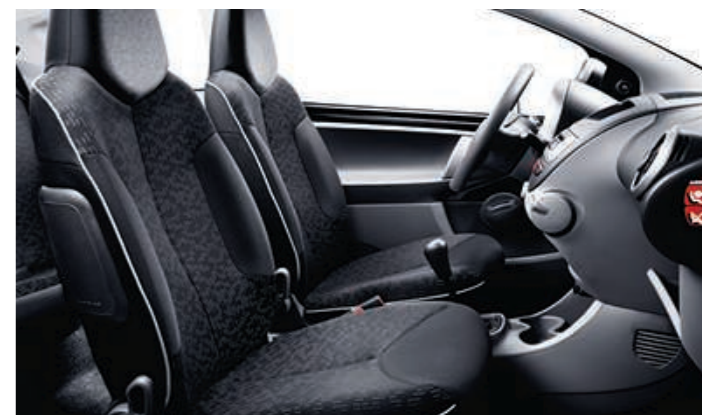
Chaîne et trame Stilada Mistral / Bise