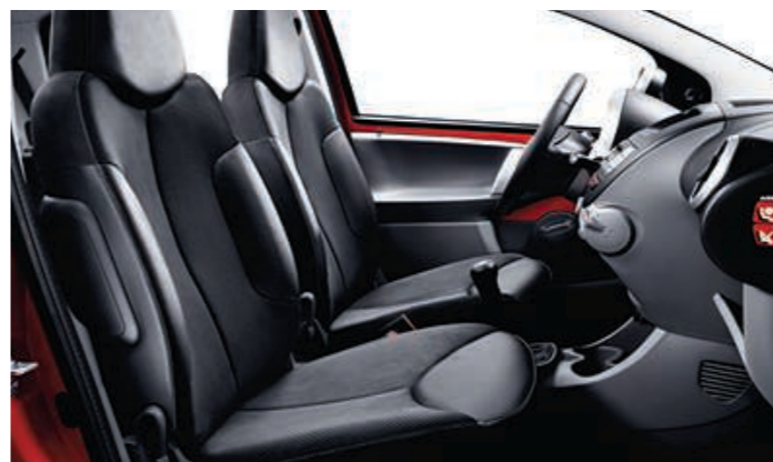
Option Alcantara / Cuir