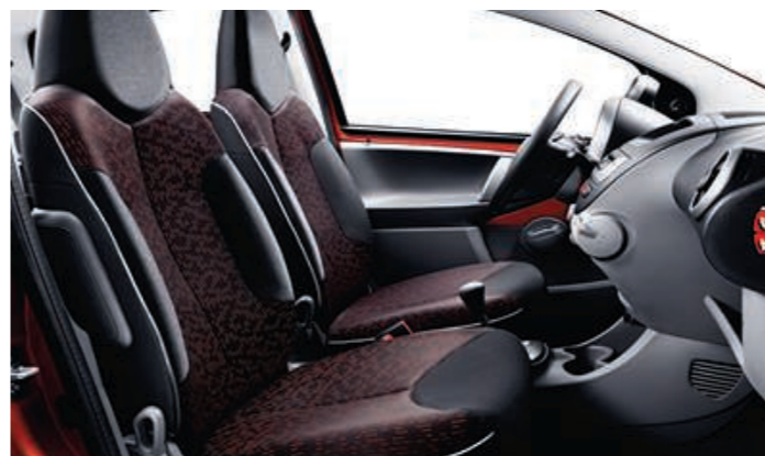
Chaîne et trame Stilada Mistral / Orange