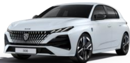
Blanc Okénite MOSU - Teinte gratuite