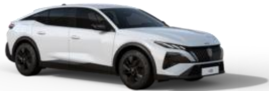
Blanc Okénite M0SU – Teinte gratuite