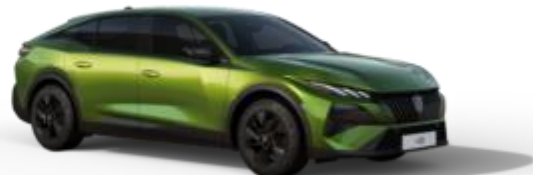
Vert Fascinant M0F9 - Option