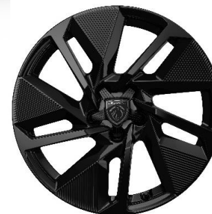
Jantes alliage 17" SILEX monoton Noir Onyx brillant De série sur Hybrid