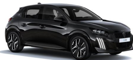
Noir Perla Nera M09V - Option