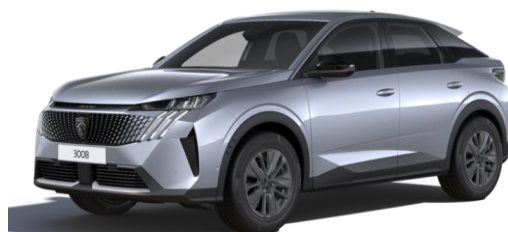
Gris Artense M0F4 - Option