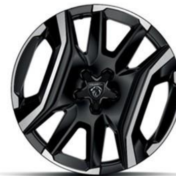
Jantes alliage 19" diamantées

BREDA Noir Orbital, vernis brillant Avec option Pack hiver