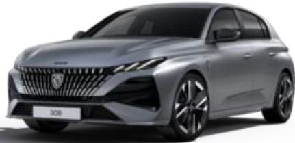
Gris Artense M0F4 - Option