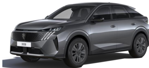
Gris Titane M01J - Option