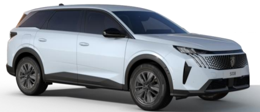
Blanc Okénite M0SU - Option