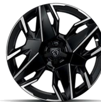
Jantes alliage 19" diamantées

BREDA Noir Orbital, vernis brillant Avec option Pack hiver