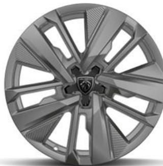
Jantes alliage 18"