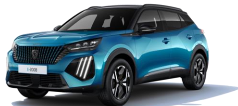
Bleu Obsession M0DP - Option