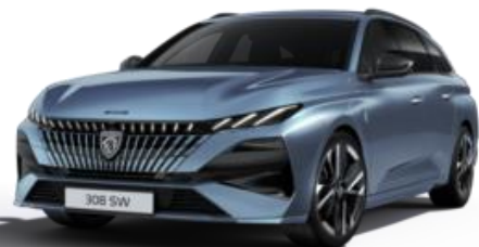
Bleu Ingaro M07K - Option (SW)