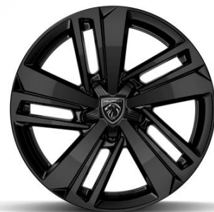
Jantes alliage 16" AUCKLAND Noir brillant De série sur Hybrid & Diesel