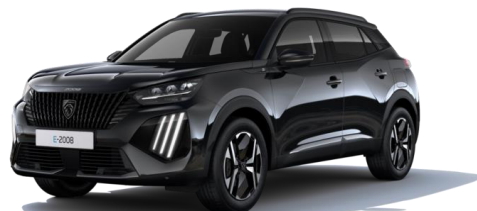
Noir Perla Nera M09V - Option