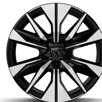
Jantes alliage 17" BANGKOK diamantées Bi-tons Noir Orbital De série sur Plug-in Hybrid