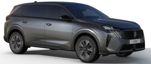
Gris Titane M01J - Option