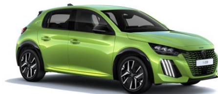
Jaune Agueda M0EQ - Option