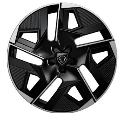
Jantes alliage 19" GRAPHITE biton Noir Onyx brillant, inserts Noir Onyx mat De série sur E-408 électrique