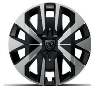
Jantes tôle 16" avec enjoliveurs MONTI Gris Eclat avec vernis brillant & noir grainé De série