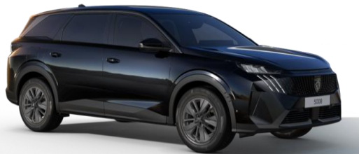
Noir Perla Nera M09V - Option