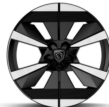
Jantes alliage 18" SEATTLE diamantées Bi-tons Noir Onyx De série sur Électrique