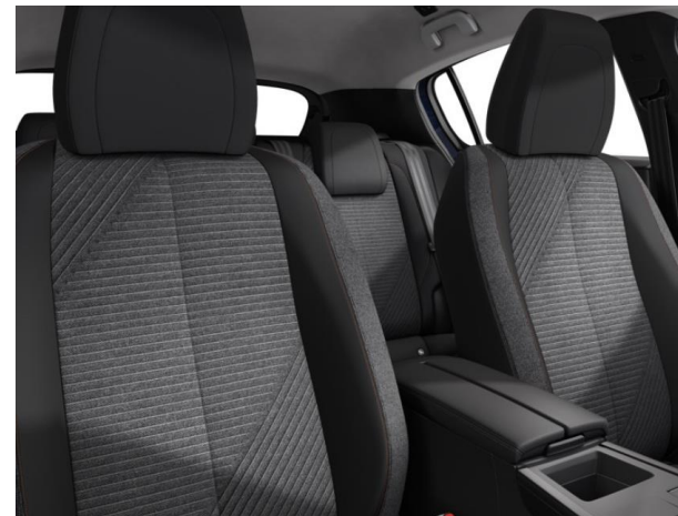
Sellerie tissu RENZO, accompagnement Baladin chiné, surpiqûres Orange Sunset G9FX