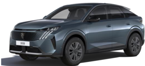
Bleu Ingaro M07K - Option