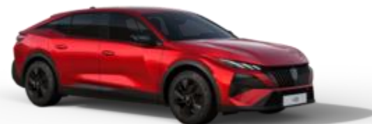
Rouge Elixir M5VH - Option