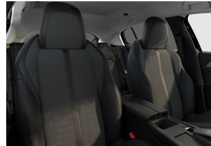
Sellerie tri-matière tissu gris TREMEZZO embossé avec accompagnement TEP Isabella Mistral et surpiqûres rose Quartz Z7FX