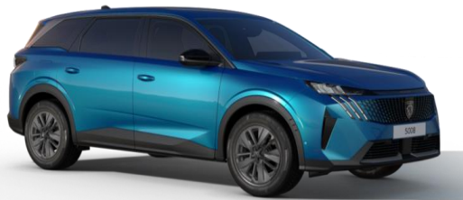
Bleu Obsession M0DP - Teinte gratuite