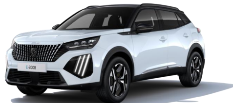
Blanc Okénite M0SU – Teinte gratuite