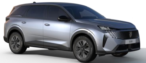
Gris Artense M0F4 - Option