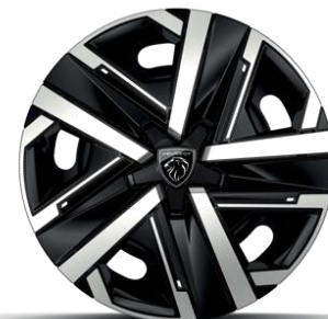
Jantes tôle 16" avec enjoliveurs SILOM Gris Eclat & Noir Orbitat, vernis mat De série