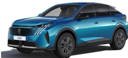
Bleu Obsession M0DP – Teinte gratuite