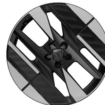
Jantes alliage 19" ADAKITE biton Noir Orbital brillant, inserts Noir Orbital mat De série sur Plug-in Hybrid En option sur Hybrid