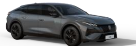
Gris Sélénium M0LD - Option