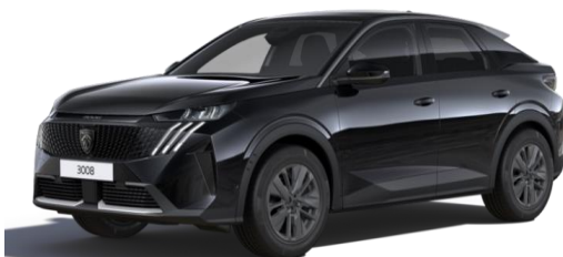
Noir Perla Nera M09V - Option