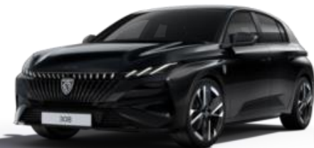
Noir Perla Nera M09V - Option