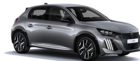
Gris Artense M0F4 - Option