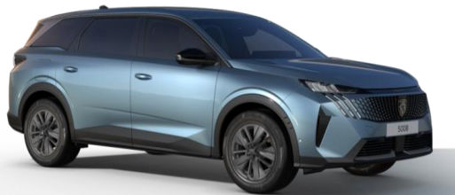
Bleu Ingaro M07K - Option