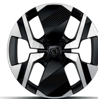
Jantes alliage 17" diamantées KARAKOY bi-tons Noir Onyx et vernis brillant Avec option Pneumatiques All Seasons 3PMSF