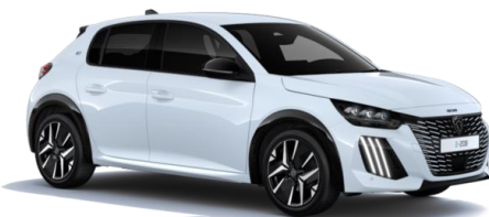
Blanc Okénite MOSU - Teinte gratuite