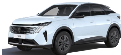
Blanc Okénite MOSU - Option