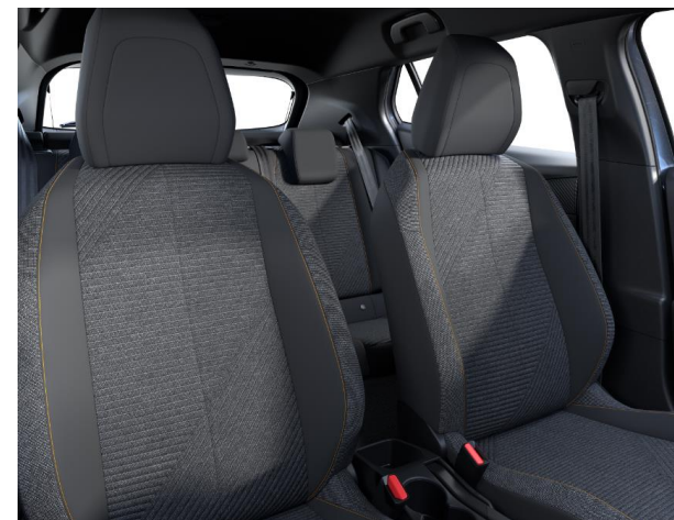
Sellerie tissu RENZO, accompagnement Rimini, surpiqûres Orange Sunrise G9FX