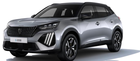
Gris Artense M0F4 - Option