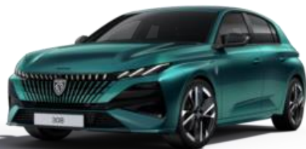
Bleu Lagoa MOKH - Option