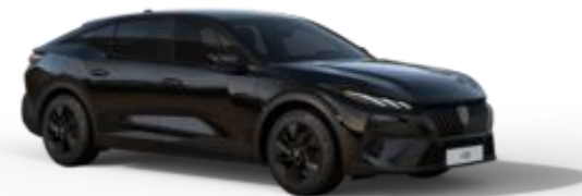
Noir Perla Nera M09V - Option