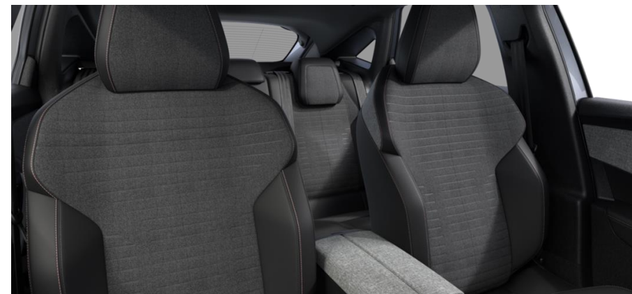
Sellerie tissu CRISPY embossé, accompagnement TEP Isabella, écharpe tissu RIMINI chiné, surpiqûres Quartz