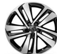
Jante alliage 17" diamantée