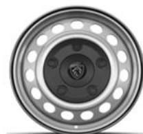
Jante tôle grise 17"