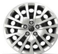
Jante tôle noire 17" avec enjoliveur